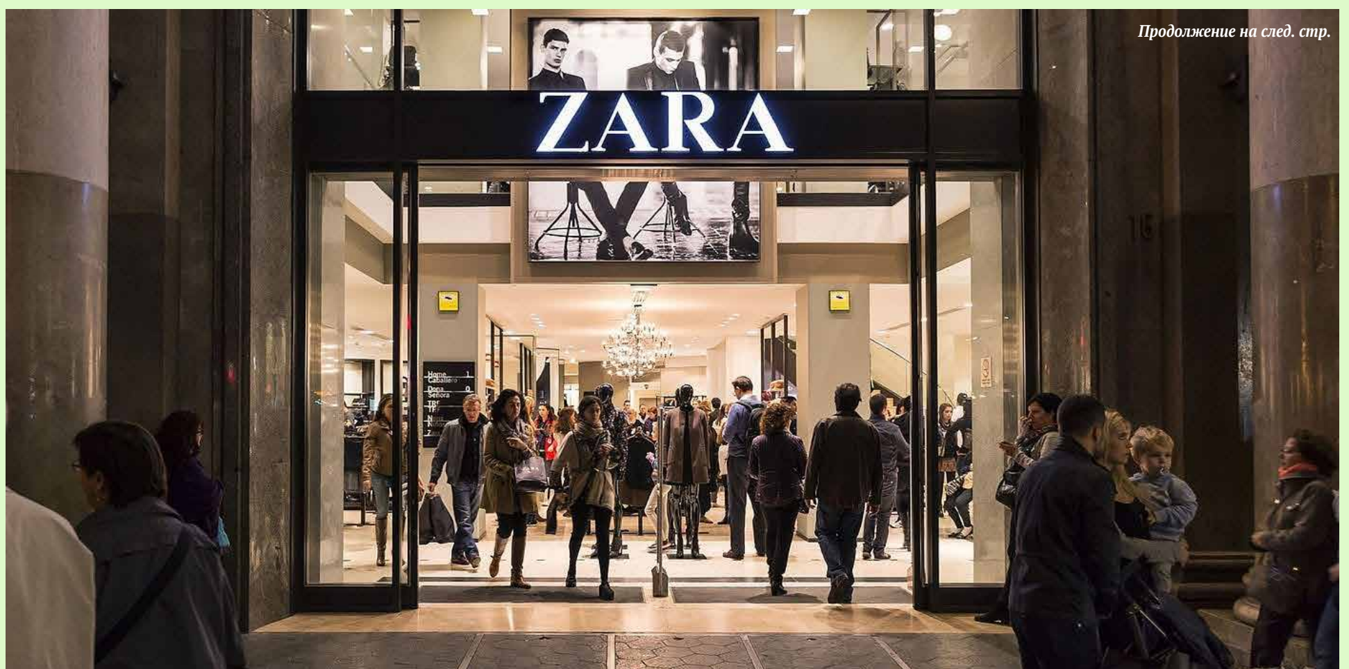
Продолжение на след. стр.

Между тем с 2003 по 2013 годы объемы экспорта одежды из Китая в США выросли пятикратно, хотя пошлина на ввоз одежды достигала 13,2%, то есть была почти в 10 раз выше, чем на большинство импортируемых товаров. Это показало, как малы затраты на производство одежды: даже при таких высоких тарифах каждый участник цепочки поставок, включая владельцев торговой марки, получал тем не менее неплохую или даже очень хорошую прибыль.