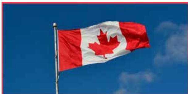
Канада отправит военных советников по вопросам гендерного равенства в Украину и

Гаити, что станет частью стремления страны интегрировать соответствующие концепции в международную деятельность.