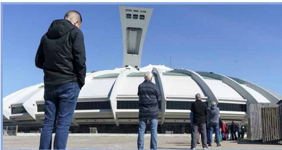
Правительство Квебека выделило организации, управляющей Олим-

пийским стадионом в Монреале, 40 миллионов долларов на ремонт и дезактивацию после пожара 21 марта.