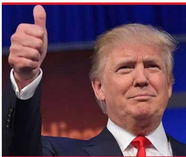
Бывший президент США Дональд Трамп прошел формальную процедуру ареста в

тюрьме Джорджии. Согласно информации издания «Ъ», эта процедура включала фотографирование Трампа, а также внесение его в список арестантов.