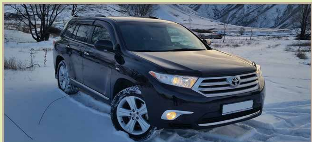
Toyota Highlander черного цвета. Такая машинка была украдена у мэра Монреала Валери Плант

Тем временем жители Монреала советуют мэру не расстраиваться, а пересесть на велосипед и обкатать все организованные ею велодорожки ;)