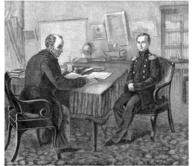
Молодой царевич Александр и его наставник Василий Жуковский

— Ваше Императорское Высочество, — ответил Жуковский, — это повелительное наклонение от глагола «ховать».