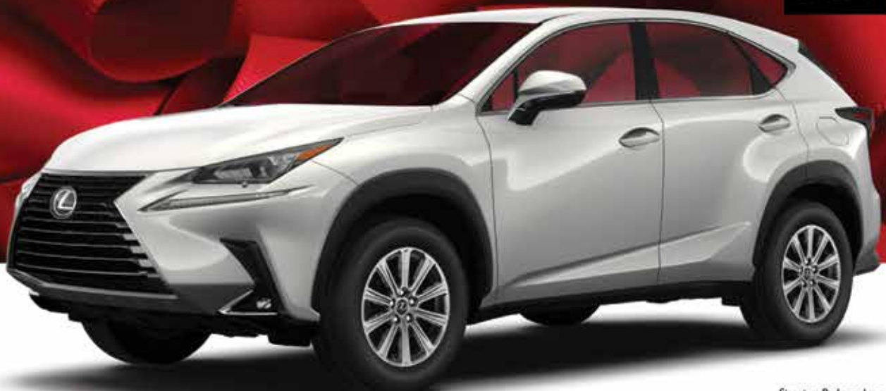
Signature Package shown