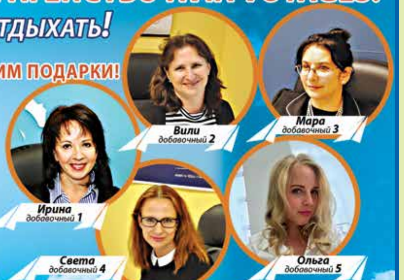
Вили дополнительный 2

AGENCE@AVIAVOYAGES.CA | WWW.AVIAVOYAGES.CA