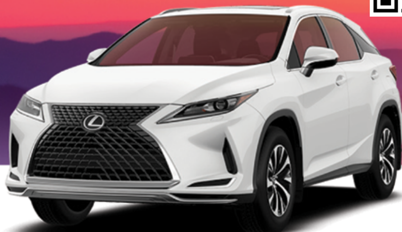
Premium Package Shown

КОНЦЕРНЫ LEXUS В МОНРЕАЛЕ / LEXUSMONTREAL.CA