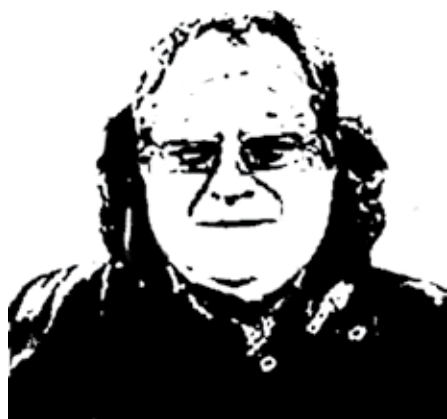
Автор: Андрей Иришкин , создатель и администратор ФБ-группы «Теория и практика психотерапии (Группа Журналов)»