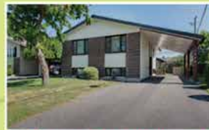
Бунгало, Le Vieux-Longueuil