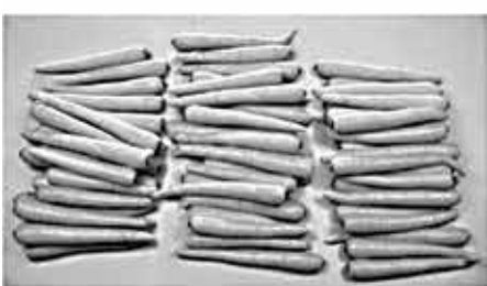
67 морковок большого размера