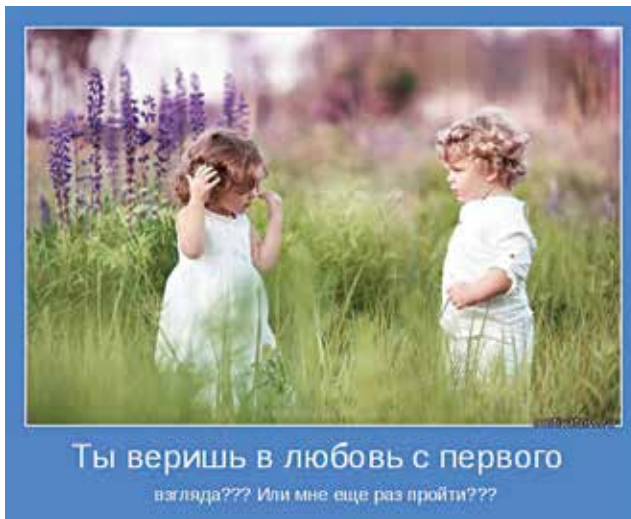
Ты веришь в любовь с первого взгляда??? Или мне еще раз пройти???

В том, что мужчины лгут, виноваты, несомненно, женщины, так как задают слишком много вопросов.